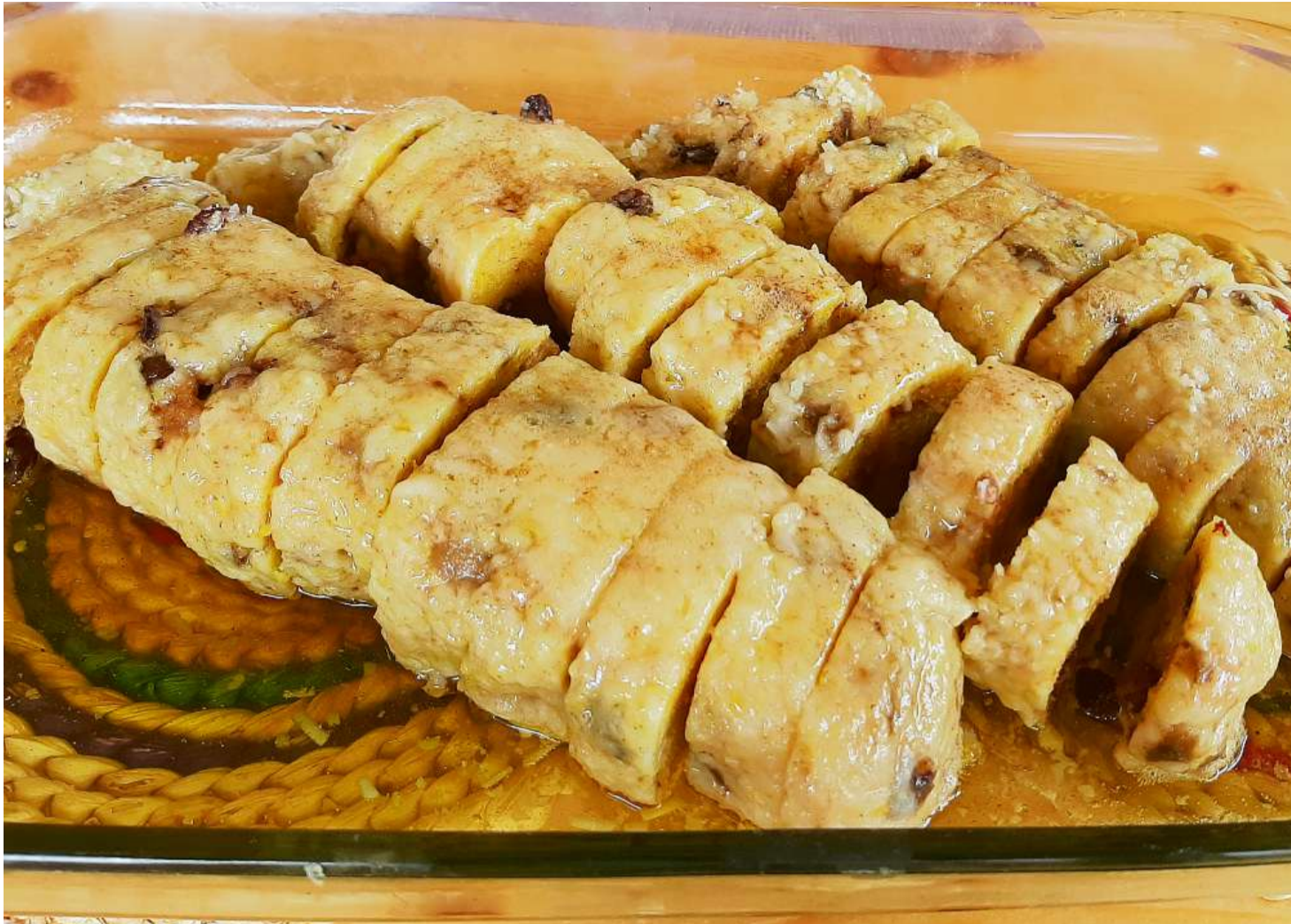
In ni plirs litguns taglian ins en rodas e tschugarnescha, avon che metter en furnel.